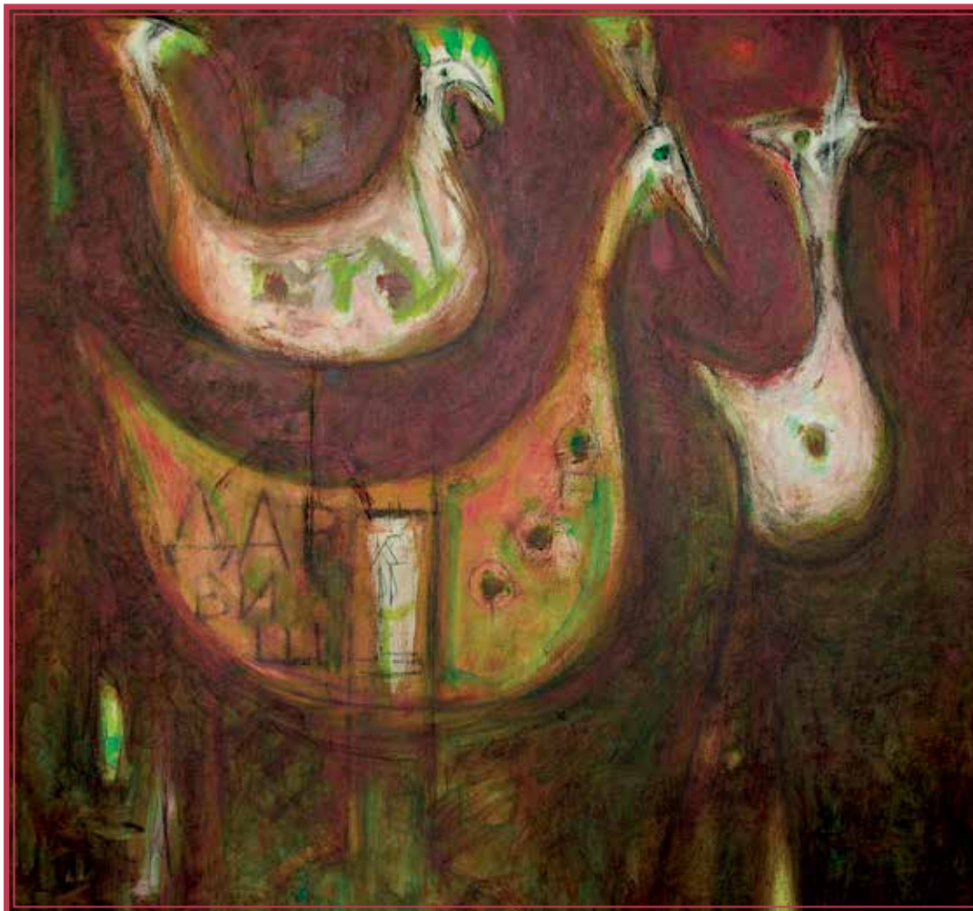
„Паун и кокошка“, 100 см на 100 см, масло на платно « Le paon et la poule », 100 cm x 100 cm, huile sur toile