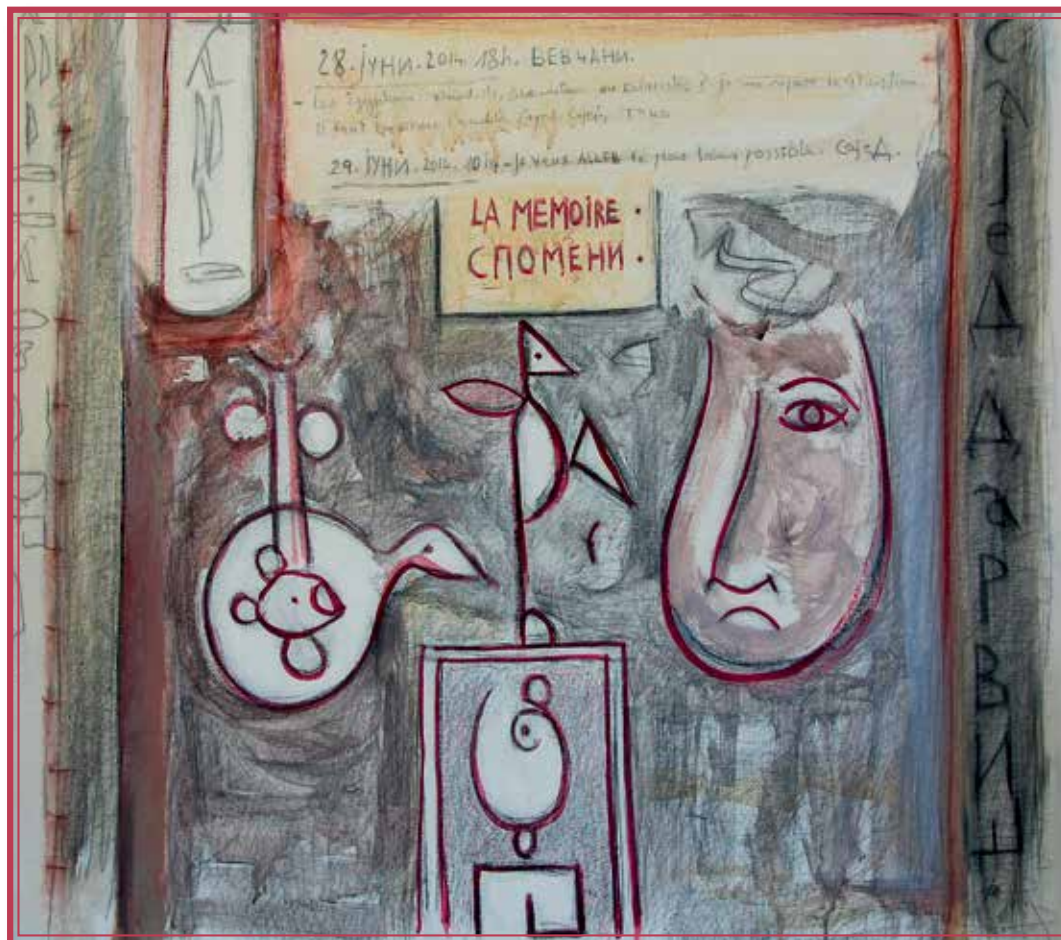
„Спомени“, 100 см на 100 см, масло на платно « Souvenirs », 100 cm x 100 cm, huile sur toile